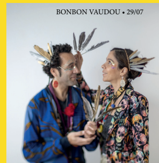
BONBON VAUDOU • 29/07

LES GOGUETTES EN TRIO MAIS À QUATRE • 28/07