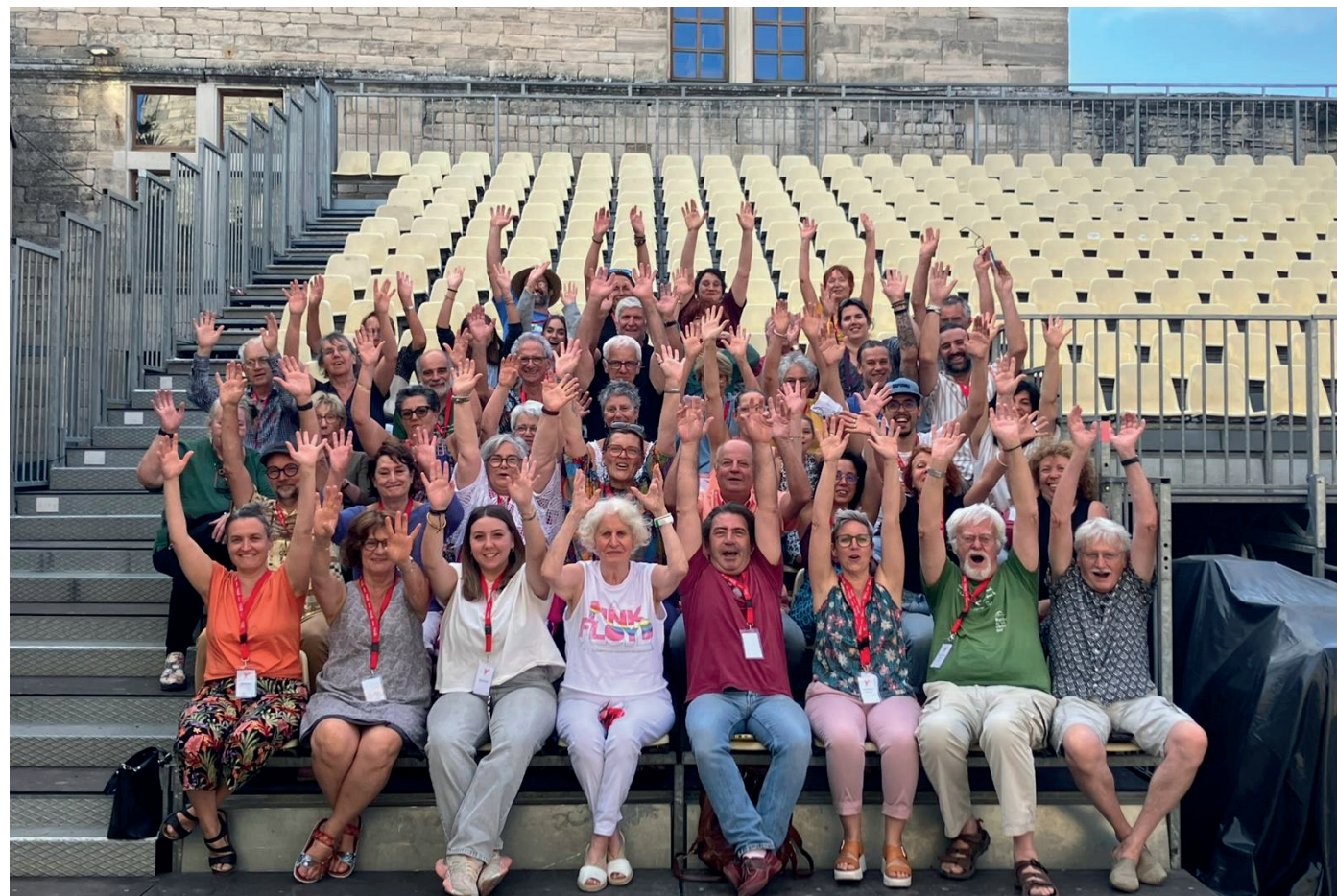
Equipe de l'association Chant Libre, Château de Barjac, 2025